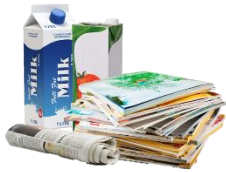
Papeles y cartón

Los siguientes materiales se pueden reciclar en Nashville. Tenga en cuenta que, dependiendo de su plan de recolección de desechos (consulte el paso 3), es posible que estos materiales deban separarse.