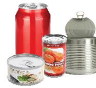
Latas de alimentos y bebidas

Las botellas de vidrio y el cartón también se pueden reciclar en Nashville, pero recomendamos mantenerlos separados durante la recolección de desechos. Muchos proveedores requerirán que el vidrio se recolecte por separado de otros materiales reciclados y el cartón puede hacer que los contenedores de reciclaje se llenen rápidamente.