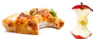
Alimentos y restos de alimentos

Los alimentos desperdiciados, el papel sucio con alimentos y los platos, vasos y utensilios compostables certificados por BPI se pueden compostar en Nashville.