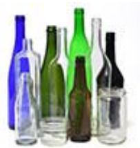
Botellas de vidrio y tarros

Las botellas de vidrio y el cartón también se pueden reciclar en Nashville, pero recomendamos mantenerlos separados durante la recolección de desechos. Muchos proveedores requerirán que el vidrio se recolecte por separado de otros materiales reciclados y el cartón puede hacer que los contenedores de reciclaje se llenen rápidamente.