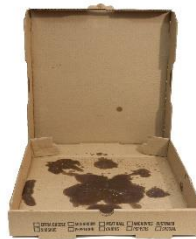
Cartón y papel sucios con alimentos