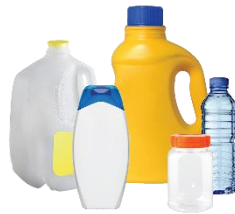
Tarros, jarras y botellas de plástico